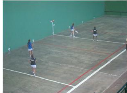
Partido paleta femenina