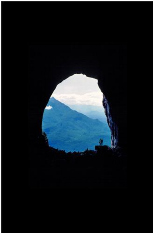
Gran Boca Txomin Viscarret