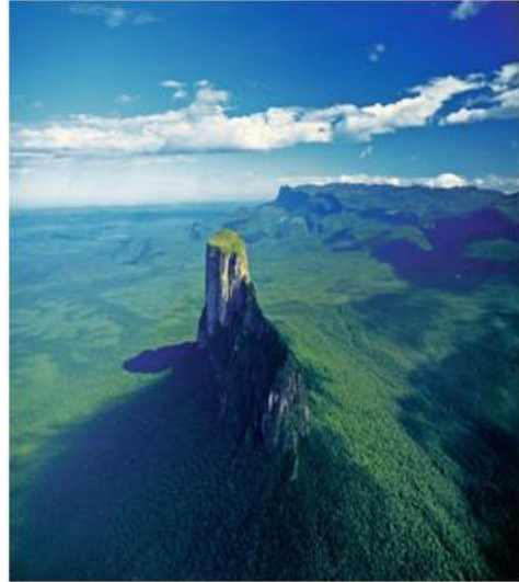
Autana.