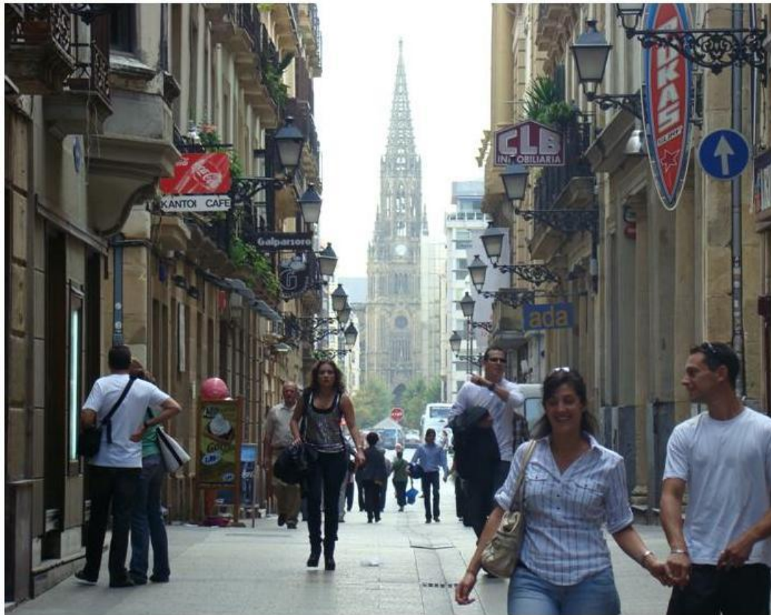
Casco Viejo. Donosti. Gipuzkoa.